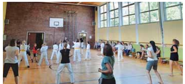
Ein Teil der Kindergruppe und „mutige Gäste“; Bildquelle: Selina Bachhuber

Als ein Highlight galt die Unterrichtseinheit "Kampfkunst Exklusiv" – eine Überraschung für die Mitglieder. Franz Wittmanns langjähriger "Mattenkollege" oder auch "Weggefährte", Dr. Fabian Wagle war eigens zum Festwochenende angereist. Sein ebenso schon langjähriger Weggefährte und Schüler und auch 1. Vorsitzender des Shinbukan e.V. gab Einblicke in die Kunst des „Tai Chi“. „Kampfkunst ist wie eine große Familie – es gibt überall Parallelen.“